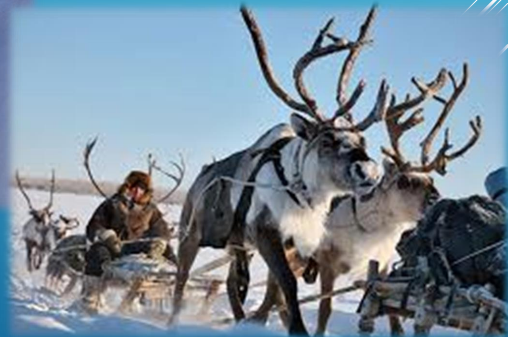
ОБИТАТЕЛИ ТУНДРЫ: СЕВЕРНЫЕ ОЛЕНИ