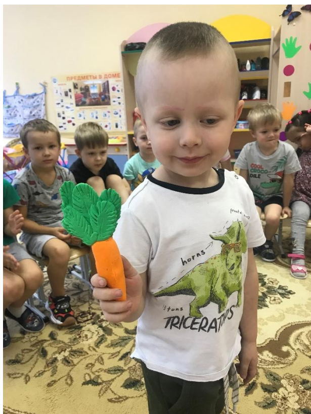
Фото-отчет о событии